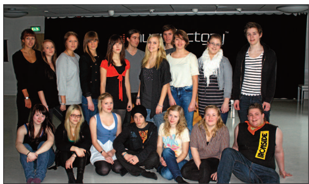
Beatlestema. Klass mop2b anordnar den andre mars en välgörenhetsshow för att samla in pengar till katastrof hjälpen i Haiti.

Både Läkare utan gränser, Läkarnmissionen och Action Aid har funnits uppe i diskussionerna. Vilken organisation