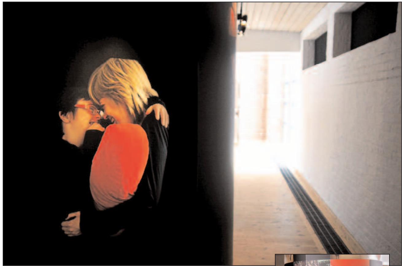
Uttrycksfullt. De 21 konstnärerna från Göteborgstrakten har lyckats fånga mycket känsla i sina bilder.

Bilderna och dikterna är uttrycksfulla. De speglar värme, närhet, längtan, förväntan, enorm glädje och